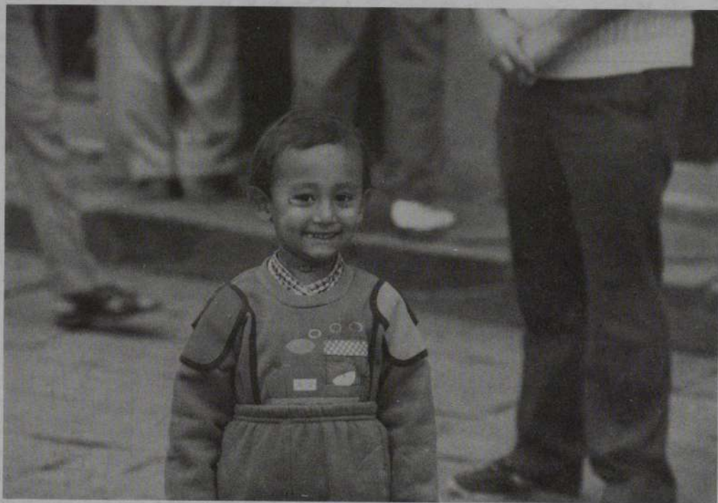
雑踏の中の子供 カトマンズにて