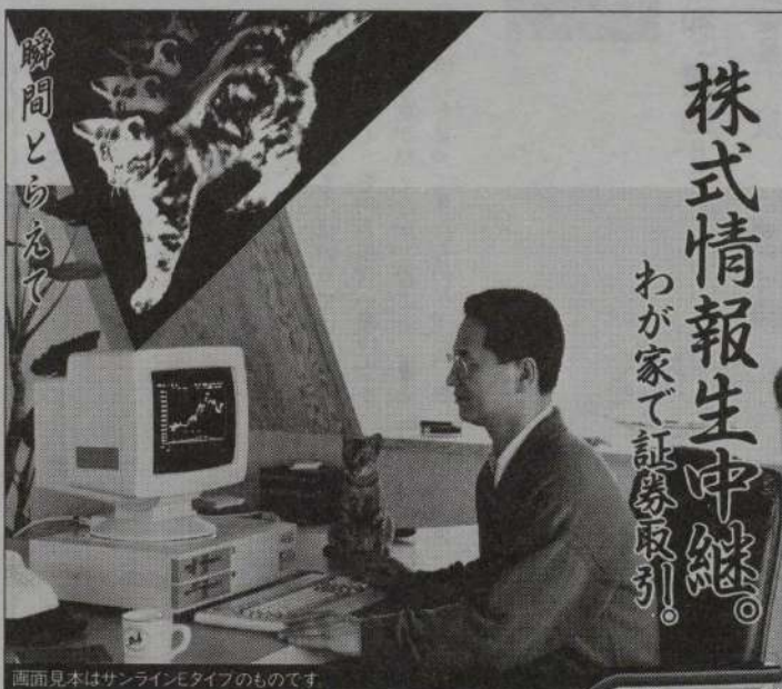
画面見本はサンラインモニターのものです。