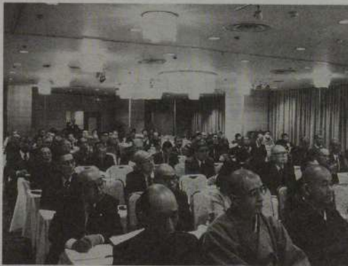
会場につめかけた参加者たち

当日、神奈川県内から集まった参加者は約二百名、税務の関心を反響してか大盛会となった。主催者側の神奈川県仏教会もこれほどの参加者が集まるとは予想できなかったという。