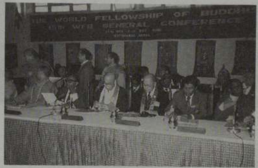
全体会議に出席の日本代表

(a)全世界の仏教徒の大多数を代表する世界仏教徒連盟(WFB)の我らは、WFBの今日を基礎づけた我らの先人たちが不惜身命の努力を傾けて、仏陀の尊い御教えを弘め、その結果仏陀の奉仕と自己犠牲の精神が世界の人々と