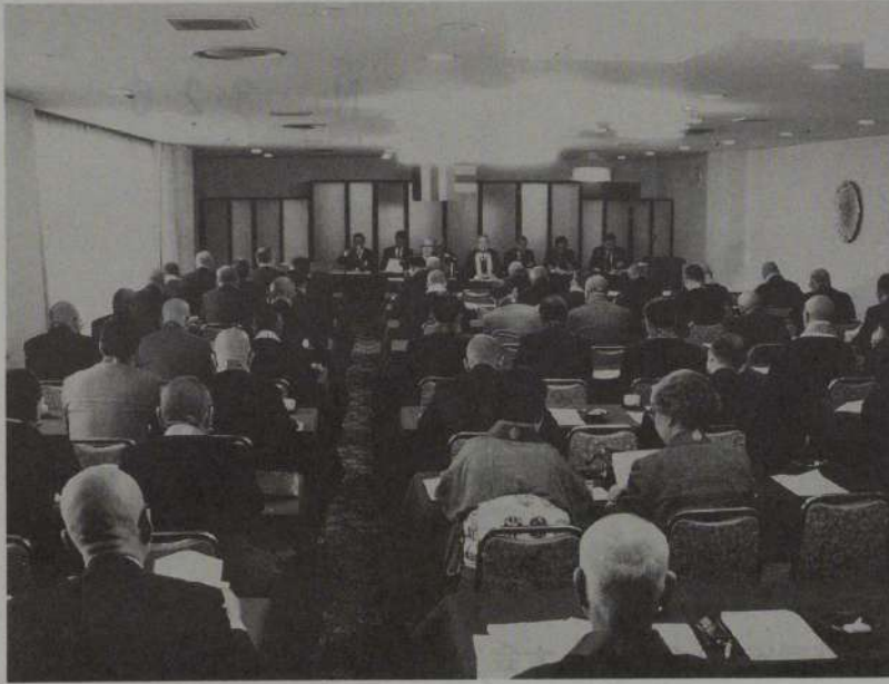
熱心に審議を続ける全仏の理事會・評議員會