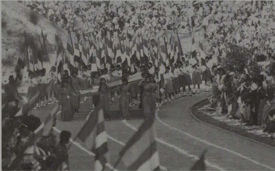
WFB大会の開会式、歓声に迎えられ仏旗の入場