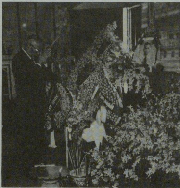
一行の滞在中に急逝された前WFB事務総長の祭壇に合掌するサンヤWFB会長

ルンビニーは平和な土地です。酷暑の時と雨期を除けば、野の花は咲き乱れ、飛び交う鳥の種類は八百種以上とか。晴れた日は北にヒマラヤの白峰を望み、広大な土地のあちこちに樹齢約百年を超える巨木が聳える、そんな野原の真中に、ポツンと白壁のマヤ堂が立っています。そばに近付くと基壇の高さだけでも三メートルもあるレンガ造りのお堂ですが、周囲があまりにも広いのと、背後に枝を上げるボダイ樹が巨大樹なのでチンマリと小さく見えるのです。