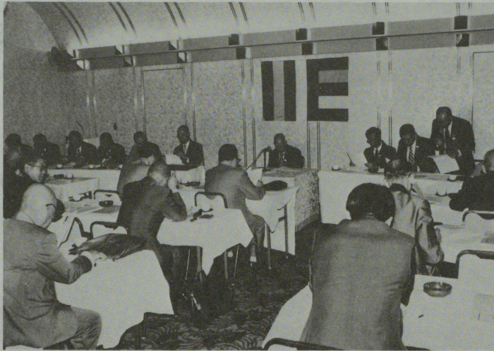
5月16日、芝パークホテルで開かれた全仏理事会

全日本仏教会の理事会は、去る五月十六日午前十一時から、芝パークホテルで開催された。 阿部理事長の三婦依文唱和、矢萩事務総長並びに阿部理事長挨拶につづいて、議長に阿部理事長、議事録署名委員に鱈