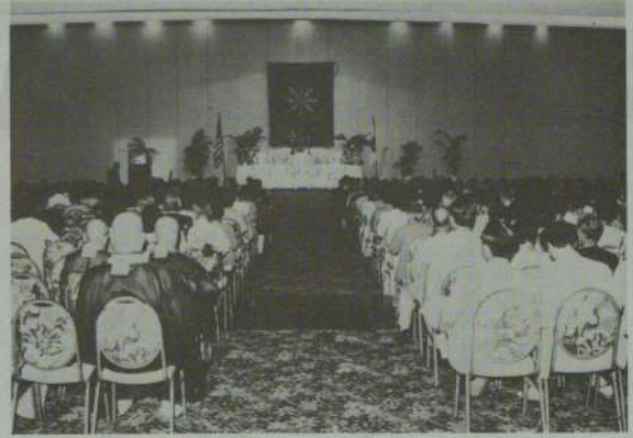
記念法要の開始を待つ約900人の参列者 (シェラトン・ワイキキ・ホテル)