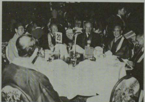
晩餐会で和やかに談笑される各師 (シェラトン・ワイキキ・ホテル)