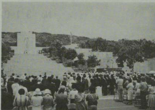
平和の女神に向って黙禱