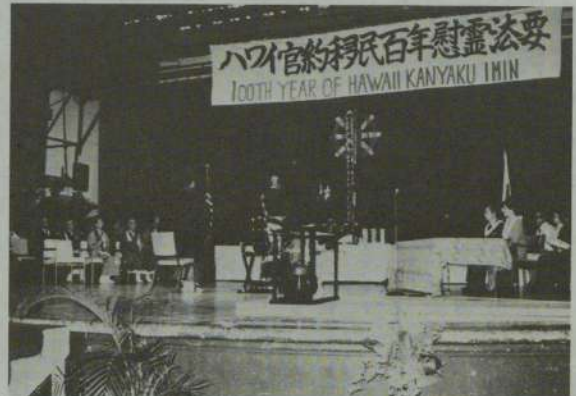
各宗教合同の追悼法要 (マッキンレー・ハイスクール)