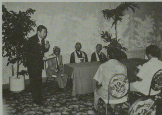
プレスインタビューをうける全仏役員 (シェラトン・ワイキキ・ホテル)