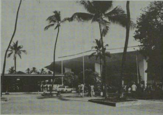
百年祭記念式典会場とな ったNBCアリーナ