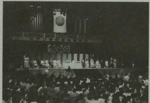
常陸宮両殿下を招いて行われた式典 (NBCアリーナ)