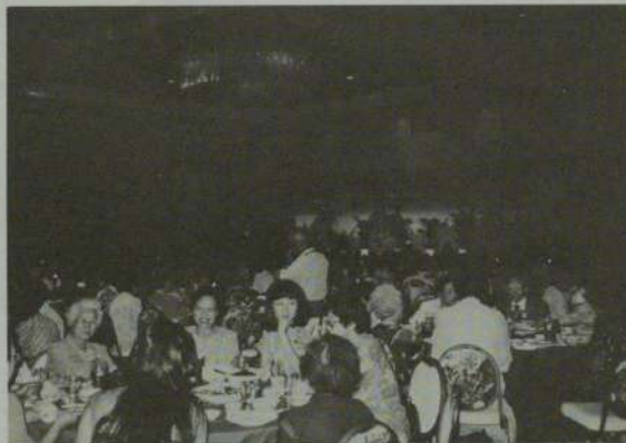
法要後に賑やかに行われた記念晩餐会 (シェラトン・ワイキキ・ホテル)