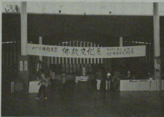
大会中開催された仏教文化展 (NBCアリーナ)