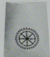
法輪袋入 -7粒入- 68円 (1ケース100袋入)

仏教教化用品の すずき出版 〒113東京都文京区本駒込6-4-21 ☎03(945)6611