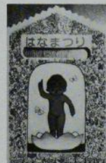
花御堂袋入 -7粒入- 98円 (1ケース100袋入)