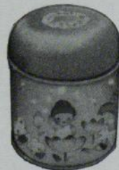
金厲缶入 -7粒入- 155円 (1ケース120缶入)