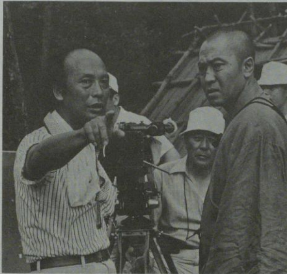
佐藤監督(左)と主演の北大路欣也

弘法大師御入定千 百五十年を記念した 映画「空海」が、い よいよこの十四日、 全国の東映系の劇場 で一般公開される。 そこで封切りに先だ ち、この超大作のメ ガホンを取った佐藤