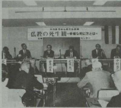
昨秋の第15回日本仏教会議

心が高まっていることもあり、会場には、二百人近くの仏教関係や医療関係者がつめかけた。またその後、新聞や雑誌等でも大きく報道され、全仏事務局へも、シンポジウムの内容を知りたいという問い合わせが相ついだ。