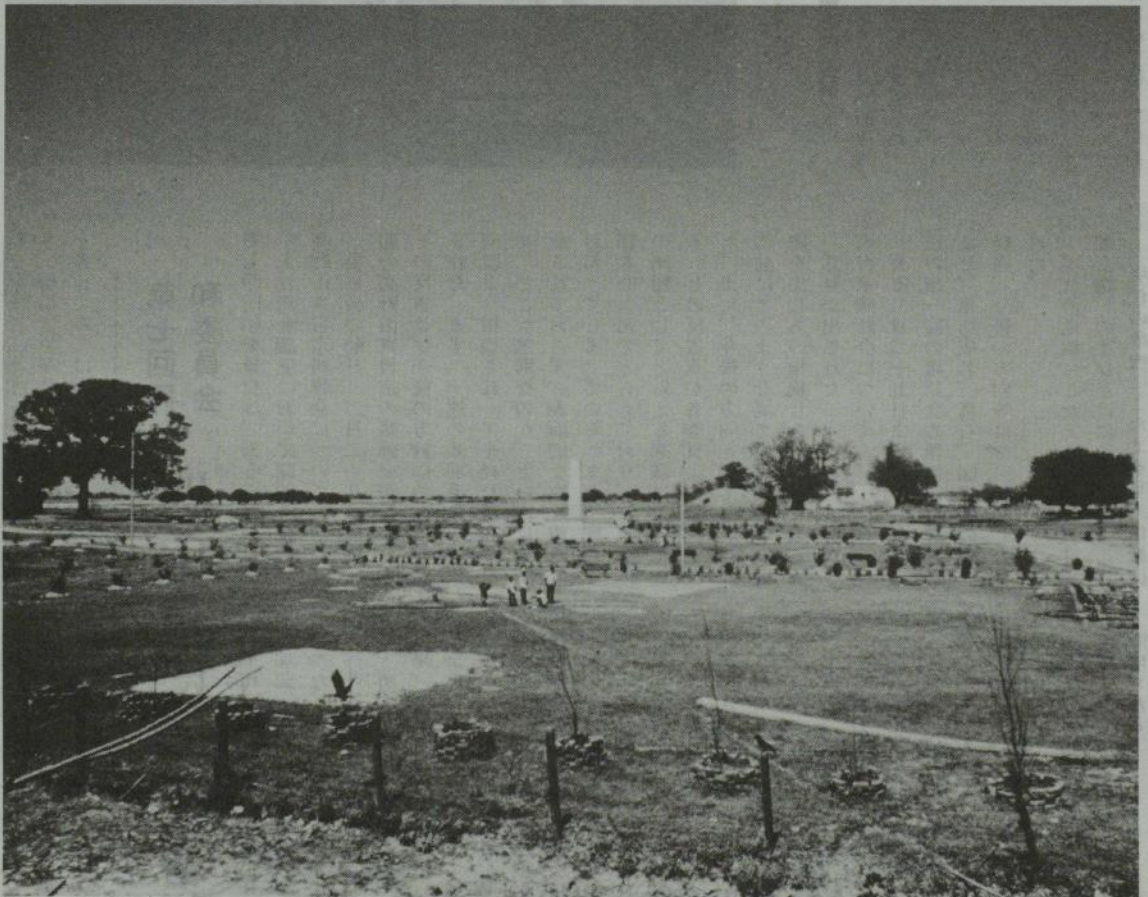
釈尊生誕の地ルンビニー園の遠望