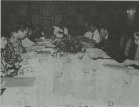
開かれたWFB執行委員会

表敬訪問に向かった。高齢のため、会長の実務はサンヤ会長代行に委任しておられるが、執行委員一人ひとり、笑顔で握手をかわされるお姿は、お元気そのものだった。お茶をこちそうになり、約二十分歓談した後、ホテルへもどり、会議を開始した。