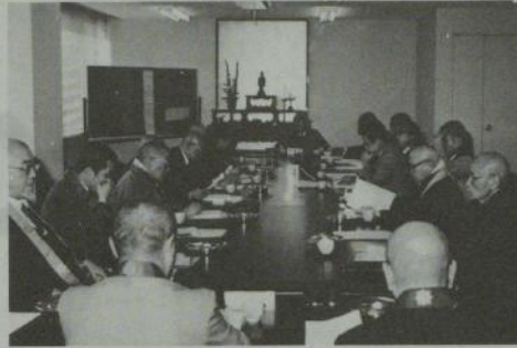
開かれた全仏常務理事会