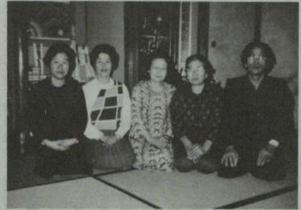
吉田さん(右)と講の人たち