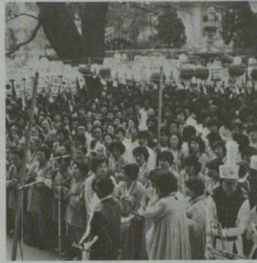
韓国花まつりのにぎわい

法要は、一日午後一時から、市内の曹溪寺で内外の来賓や多数の信徒が参加してとり行われた。また午後六時から、提燈大法会が約二〇万人の参列者でにぎやかに行われたが、ここで全仏会長からの祝辞も伝達された。