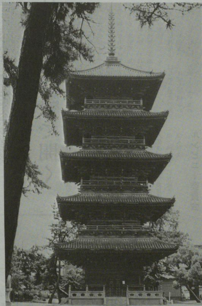
善通寺・五重塔(香川県善通寺市)