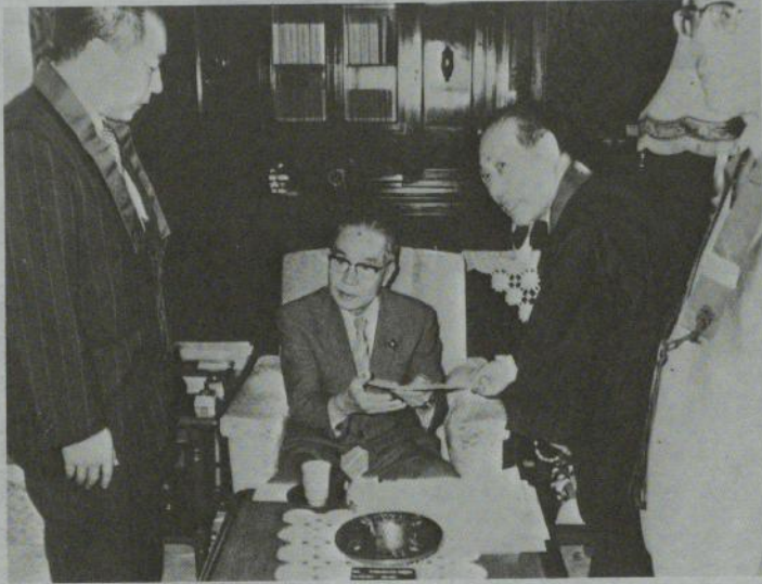
要望書を受け取る小川文部大臣

去る七月六日、「国宝・重要文化財の修理・管理・防災事業の充実についての要望書」が、小川文部大臣及び自由民主党あてに提出された。 この日、全仏の小野島事務総長、北山国際文化局長、阿純孝文化財相談員、山田文化部長、野生司主事の五人は、直接文部大臣をはじめとする関係者に、仏教