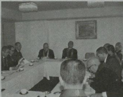
評議員会に先だって開かれた総長会