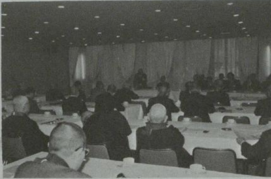
共通議案のため合同で開かれた理事会、評議員会

「税制委員会設置に就て」 担当局長、部長より事務局案を説明し原案通り承認。 議案第五号 議案第五号 「人事に就て」 担当局長、部長より説明し、新評議員を了承。また評議員会で理事を選出、理事会で常務理事を選出し承認。全仏の総務局長交代を了承。