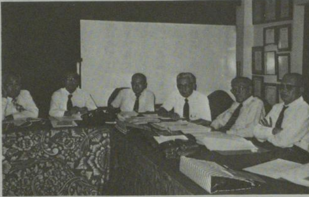
開かれたWFB執行委員会