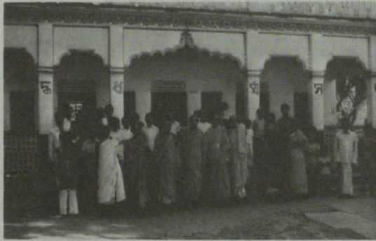
ずらりと並んだバンングラディシユの僧侶たち

バンングラディシユは総人口七千九百万人(一九七二年)と推定されているがそのうちイスラム教徒は七七%、ヒン