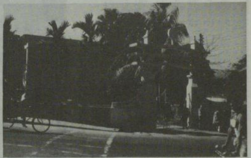
バングラディッシュの街頭風景

私の印象ではバングラディッシュの仏教はきわめて純粋な上座仏教である。スリランカの村落寺院の仏教よりも、さらに混り気が少ないように思われる。どうしてそのように純粋な上座仏教が行われるにいたったのであろうか。