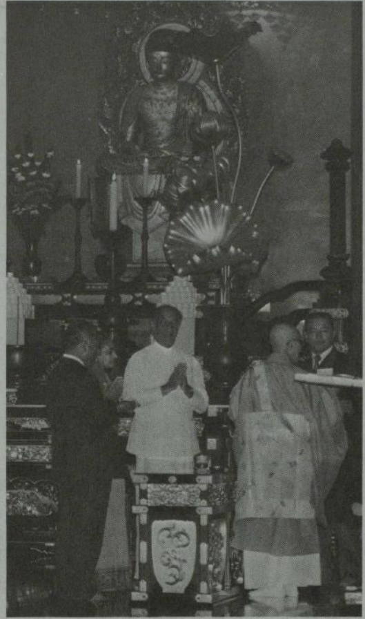
増上寺で藤井法主に挨拶される大統領