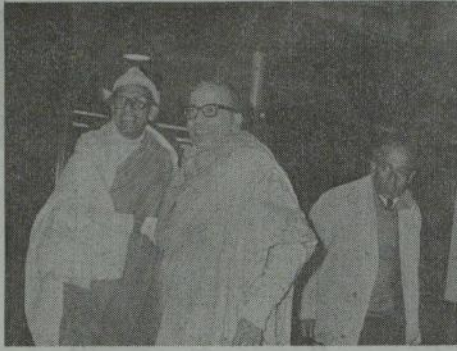
来日したビ長老一行（羽田にて）

仏の呼びかけに加盟各宗派、梶仏、諸団体や寺院、仏教徒等より八百万円の救済金が寄せられ、それにより孤児の収容がより多くできるようになり、その答礼とさらに援助を要請するためである。