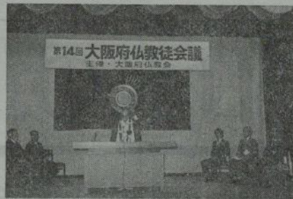
「大阪府仏教会」を今年一月全会員に一冊ずつ無料配布することができた。

一、昨年来本会が打出した例の「黒い法要」追放促進運動も全国的に波及してその面目をほどこしているが、大阪府下でも今年度に二、三の例をのぞいて、その実施が反省されて社会的状況の影響もあって、徐々ではあるがその成果が見られる。