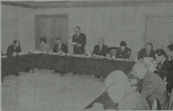
四月四日午後三時より東京・芝のソートービル会議室において日宗教連盟の