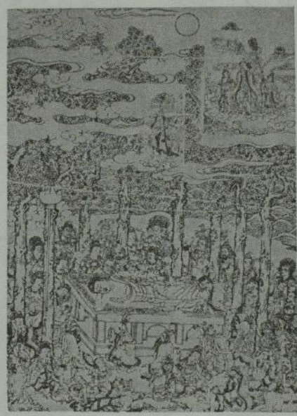
写真は「涅槃図」の部分 —板木は江戸中期のもの—

頒布価格 1幅 15,000円(解説付 荷送共) 寸法 ねはん図 60cm×105cm 仮表装出来上り 82cm×170cm