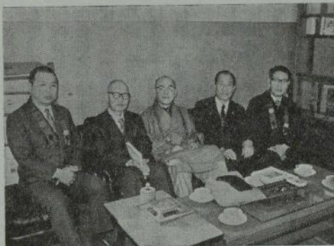
来局した文理事長（右から二人目）

まる。熱湯をそそいだ粉が耳たぶぐらいの堅さにと、先輩の指図でこねられる頃には、絵具をとくものや、胡麻を煎るもの等、それぞれのなれた持場で噂話と原料を半々にこね合わせる位の勢でにぎやかに、やがて横に細い熊笹の棒かなにかで囲みをつけて、せいろうで蒸し上げられるとそれで出来