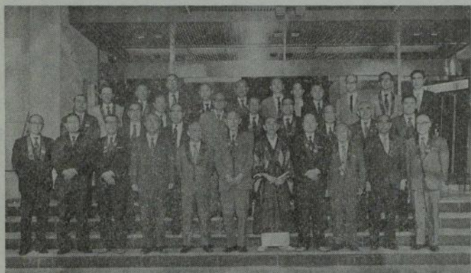
伊東のホテルで記念撮影の一行

会議は、貝山師を議長として「一、昭和四十九年度全日本仏教徒会議について」日時、会場が既報の通り今年十一月六日、京都・和順会館に決定した旨、全