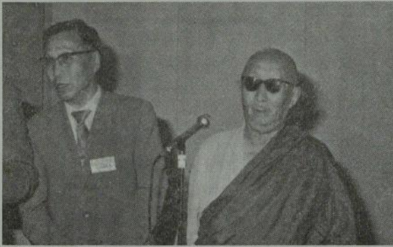
あいさつするソ連の仏教会会長

院に対する選択の自由は、僧侶、寺院に 対するそれよりも遙かに高い。そして医 師には学位の表示について制限があるの に、僧階については表示の制限どころか 世人は僧階の無意味さについてよく知っ ているという他ない。そして横行するの は、医学の進展を無視した所謂めくら医 療ということになれば、砂漠の民は飢え や渴きを何処にいやしたらいよいよとい うことになるか。 譬喩が全分をおおうものでないことは 言うまでもない。しかし日本人の全てが 患者もしくは患者になりつつあるともい