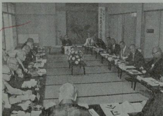
県仏代表者会議―鳳凰の間

「全一仏教運動の昂揚と組織強化」をテーマに、東京、北海道、大阪、京都、青森、山形、福島、栃木、群馬、埼玉、千