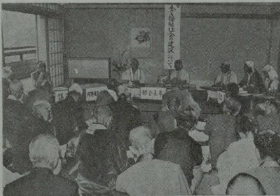
第二 部 会