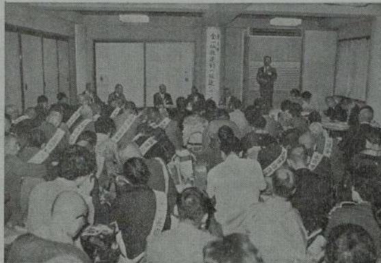
第五部会——

議案というよりも、従来、家庭人とし て社会人として教化活動、社会事業に 全一仏教運動を展開してきた婦人連盟 の方々がさらに一層、この結成二十年 の大会を期して、心を新たにこれを推 進していこうという決意を披瀝して協 賛を求めたものである。