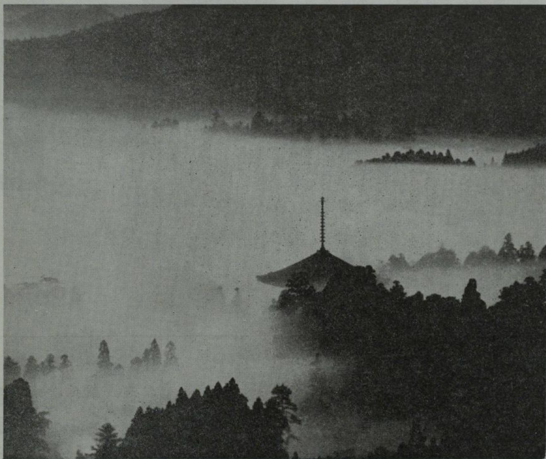
(初日に輝やく聖地高野山)