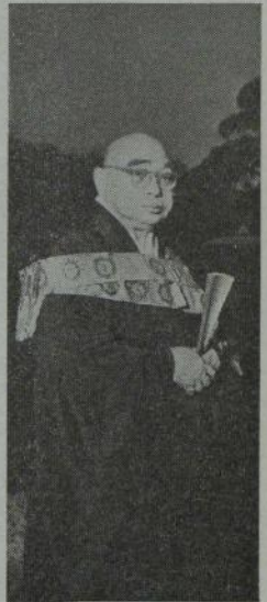
岩本勝俊 禅師 (曹洞宗管長)