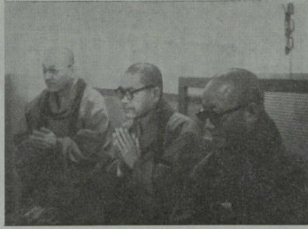
(歓談する代表者達)