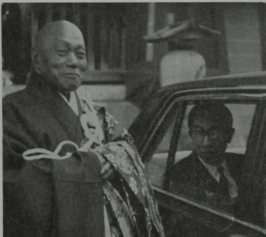
(梶浦逸外妙心寺管長と三笠宮殿下)