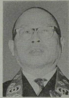
全日本仏教会副会長