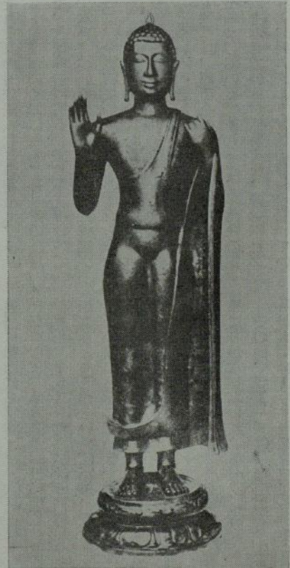
紀元十世紀の作品で南インドで発見された仏像 (マドラス・政府博物館蔵)