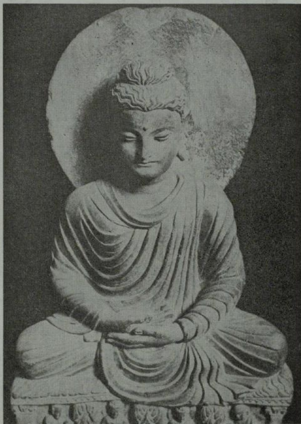
紀元二世紀の仏像で西バキスタンで発見された。ガンダーラ彫刻と同様にギリシヤ、ローマ芸術の影響をうけている (インド博物館蔵)

万国博が開場されてから既に二カ月余、入場者はウナギ上りに増加している。それほどまでに、どのパビリオンも好評なのだろうか。 「いや期待はずれだった。安易な写真展示が多すぎる」とか「あまりにも機械的に走りすぎる、人間までもがロボット化されそうな気がする」こんな世評のなかでアジア関係の各館は流石に人間の心を失っていないと好評だ。そのなかでも大国らしくインドは仏教を中心に神秘的な文明を私たちに学ばせてくれる。 今回はインド館に出展されているうちの二、三をインド大使館のご好意で紹介した。なおインド大使館よりの申し出により、全日仏紹介のインド館見学者には特別の配慮がある。申込みは全日仏文化局へ。