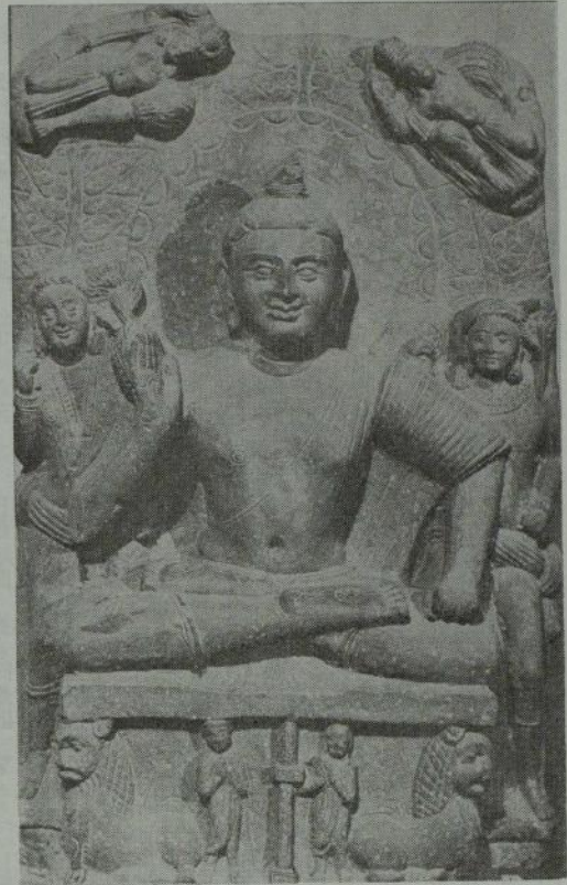
紀元二世紀の作品で仏の力を表わしたものである (インド博物館蔵)