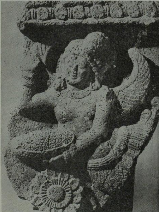
半人半鳥の彫刻で紀元前二世紀の初期作品である。オーランガバットの ピタルコラの洞窟で発見された (国立博物館蔵)