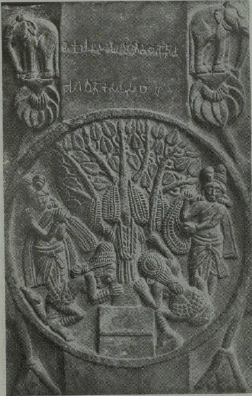
カシヤバの菩提樹の信仰を表わした欄楯。紀元前二世紀の作品 (インド博物館蔵)