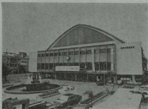
全日仏徒大会会場

両大会ともに現下の社会人心の迷動をみると、大きな意義をもつものであり全国仏教徒の総結集を具現しなければならぬ。