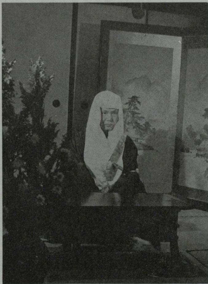
(天台座主 即真周滿貌下)

根本伝教大師曰く国宝とは何物ぞ、宝とは道心なり、道心ある人を名けて国宝となす。 故に古くの言く「径寸十枚は国宝に非ず、一隅を照らす、これ則ち国宝なり」と。