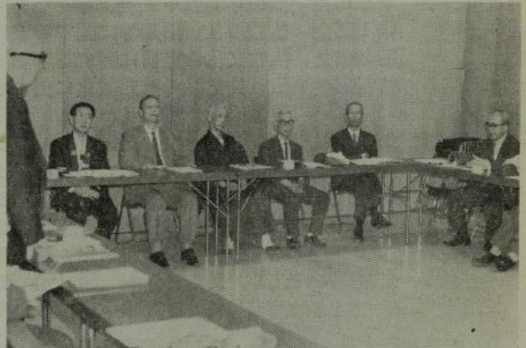
(写真上) 7月4日大阪難波別院で開催の近畿北陸ブロック会議

客引き河童といって神徳あらたか、とりわけ水に縁のある商売に御利益があり、この大明神さまは御利益を授けるだけで、罰は決しておあてにならない寛容と調和の神さま。月祭は毎月二十三日、大祭は八月二十一日から三日間。