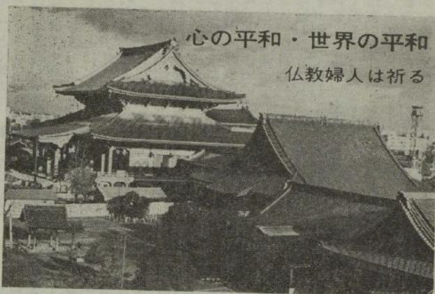
会場にあてられた大谷派名古屋東別院