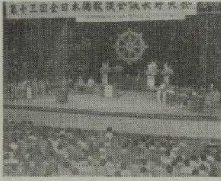
(写真) 第13回大会のもよう

寄附行為に具体的に会議として定められたものでなく、一事業として採り上げられてきたが、回を重ねては盛上りは量質共に向上して来たが、その本質を理解される向きは少ない。