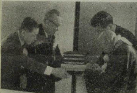
聖書を受ける全仏高階会長(右)

当日はこの大会の発起人代表吉田茂元総理の開会の辞には「まじりNHK交響楽団による荘嚴な演奏により全員黙祷をさし、世界平和への祈りのことば、平和宣言等があり、終つて「故ケネディ大統領を偲んで」と題する講演と、在りし日の故大統領のフィルム等が上映され、参会者全員は大統領の尊い犠牲を大いなる基盤として、人類の悲願である「平和」のために努力し合うことを誓い合った。