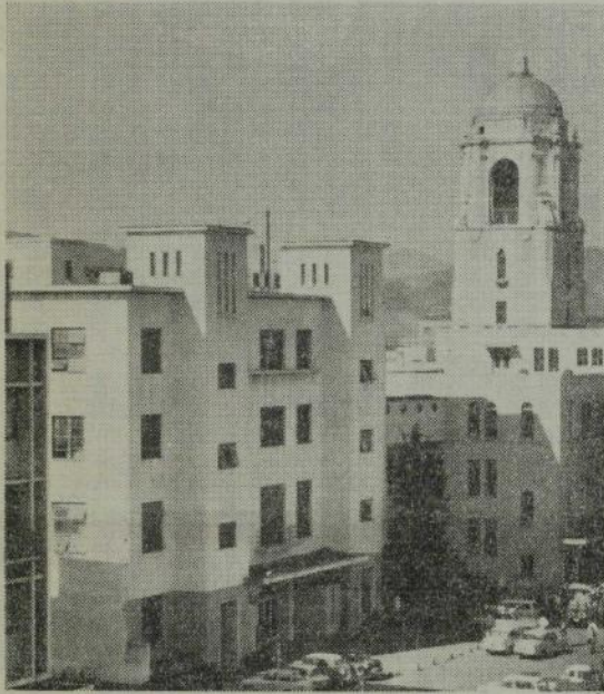
（写真）部会場にあてられる静岡市公会堂

局において一切の御世話を願うことになっておりますので、申込みはその方（静岡市井ノ宮、瑞竜寺内全日本仏教徒会議静岡大会事務局）にお願いいたします。