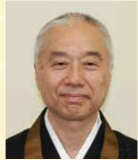
全日本仏教会理事長