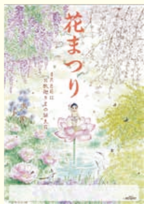
第2回ポスター大賞作品