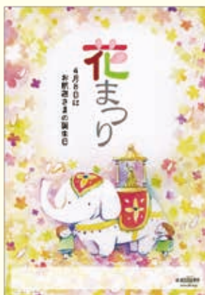
第1回ポスター大賞作品