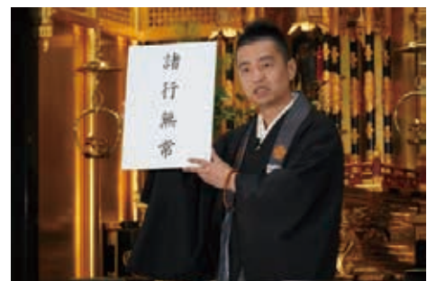
「いま、あなたに届けたい法話」の動画配信の様子

【いま、あなたに届けたい法話 https://jodo-shinshu.info/ima_howa/ 】