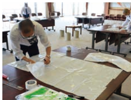
防護服作りの様子

また、天台宗の役職員により、簡易防護服作製支援プロジェクトに参画。感染のリスクを抱えながらも最前線で医療に従事いただいている皆様を少しでも支援するべく、今現在も作製を継続しています。