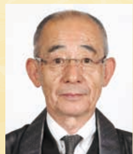
全日本仏教会事務総長