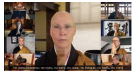
「みんなで唱えよう～般若心経～」英語

国際布教総監部・国際センターによる合同企画として、広がり繋がり、そして心の安寧を感じてもらうため、新型コロナウイルス感染症でお亡くなりになられた方々のご冥福、闘病中の方々のご快復と一日も早い事態の収束を祈り、世界各地より108名の僧侶が声を合わせて日本語と英語で般若心経をお唱えする動画「みんなで唱えよう～般若心経～」をYouTubeにて配信しました。全国曹洞宗青年会では、疫病退散、病氣平癒、早期終息を祈願し、新型コロナ退散祈願オンライン法要を執り行い、また、お寺での坐禅会が難しい状況であることから、Zoomによるオンライン坐禅会を開催しました。いずれも多くの方にご視聴・ご参加いただきました。感染の脅威から解放された生活が戻ってくることが一番ですが、その見通しが立たない今、SNSを通じた情報発信と新たな生活様式に合わせた布教教化活動を展開していく予定です。