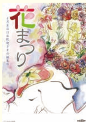
第3回ポスター大賞作品