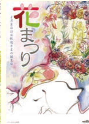
第3回ポスター大賞作品