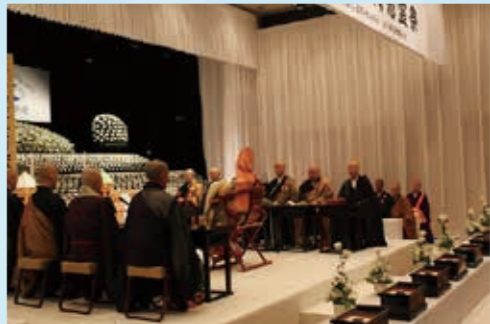
2011年11月5日 東日本大震災犠牲者合同慰霊祭

震災から半年後になる2011年11月5日「津波防災の日」に、全日本葬祭業協同組合連合会が主催、全日本仏教会と東京都仏教連合会が後援で、東京の増上寺で「東日本大震災犠牲者合同慰霊祭」を行いました。その経緯はどのようなものだったのでしょうか。