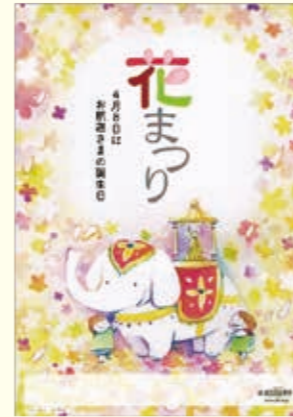
第1回ポスター大賞作品