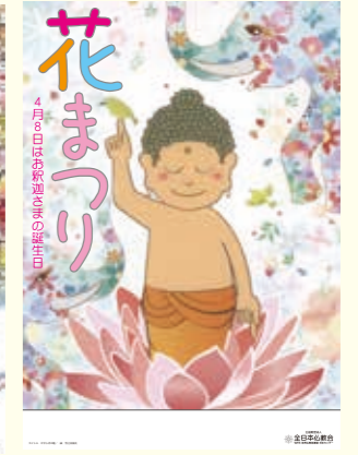
第4回ポスター大賞作品