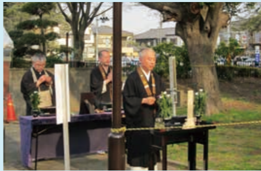
2011年4月2日 東京都 瑞江斎場にて

先ほど火葬の協力をしたという話がありましたが、あれは石原都知事が被災3県の知事からの要請を受けました。こうした情報も初めは全葬連さんに入ってきました。宗教界はそこから情報をいただいて、そして行政に申し出ていく。初めのうちは宗教者の言うことを行政は聞いてくれませんでした。そういうことが超えなきゃいけない、変わらなきゃいけないことだとこの時考えました。