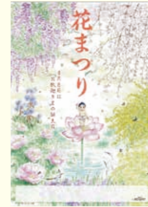
第2回ポスター大賞作品