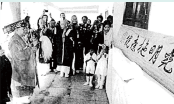
光明施療院寄贈式的一条智光善光寺大本願上人

各宗派・仏教団体の名前が並び、日本仏教界が総じて日本寺の建立を祝したことが伝わる当時の日程（『全仏』192号（1973年11月号）より）