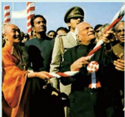
日印親善、世界平和の祈りを込めて梵鐘を撞ちならすギリ大統領

ミャンマー、スリランカ、中国、チベットの、タイに続くブツダガヤにおける6番目の寺院建立でした。左の