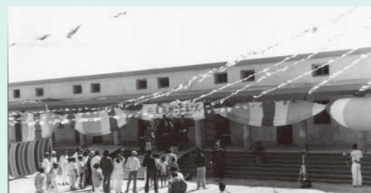
菩提樹学園落成式 / 1977年(昭和52)年12月8日

保育施設建設に向け、主に日本仏教保育協会会員園の園児を対象とした、「百円玉募金」が1975（昭和50）年9月より実施されました。1976（昭和51）年4月12日、祐天寺にて、現地の建設会社であるパークネット社に、建設を依頼。日本仏教保育協会は、立会人・関与者として契約書に調印し、5月1日に着工。そして、1977