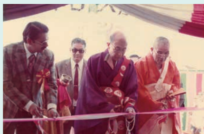
菩提樹学園ティーブカット

（昭和52）年2月15日、現地日本寺本堂において大谷光照名誉会長導師による落慶式が挙行され、「菩提樹学園」と命名され、同年12月8日成道会の日に開園いたしました。