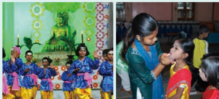
菩提樹学園45周年記念お遊戯会 / 2023(令和5)年12月7日

現地の状況をふまえ、菩提樹学園では子どもたちの幸福を願い「子どもの心身の発育を助長し、基礎学力の習得、自分で考え正しい行動ができる子どもの育成」を目標とした教育が始まりました。月謝は無料のうえに、毎日給食があり、素晴らしい