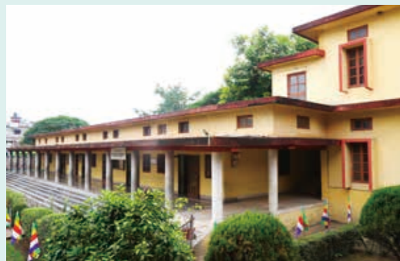
現在の菩提樹学園（2002年、日本仏教保育協会の寄附により増築）