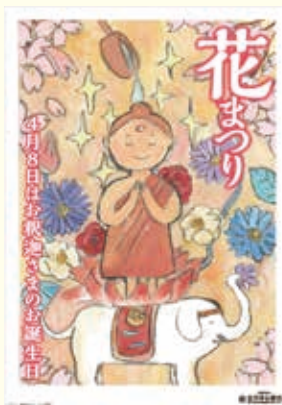
ポスター大賞作品(一般)