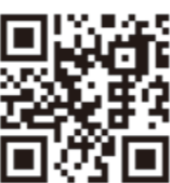
国際仏教興隆協会ホームページ

疑応答は熱を帯びたものとなりました。また先生は、日本寺50周年に伴う仏跡巡りツアーにも同行され、立ち寄った各所で解説してくださいました。