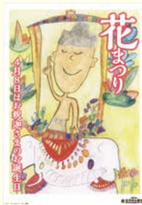
ポスター大賞作品(満12才以下)