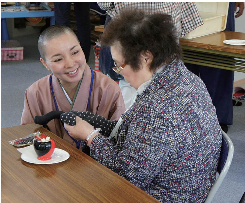
語り合う臨床宗教師

なかった。こうした活動は葬祭における役割と対立するようなものではない。むしろ、補い合うものである。臨床的な活動に携わることによって、葬祭における遺族との交わりも宗教性の深みを増していくと感じられる。