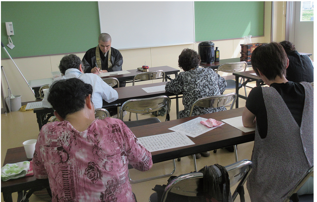
被災地での写経会

こうした変化は、社会が伝統仏教の意義を見直していることの反映と評価することもできるだろう。富や快適さを求め、業績の拡大を