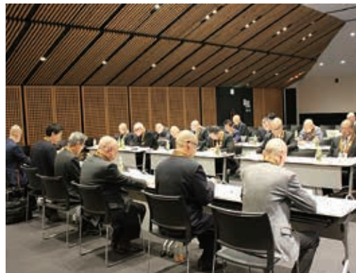
代議員会議の様子