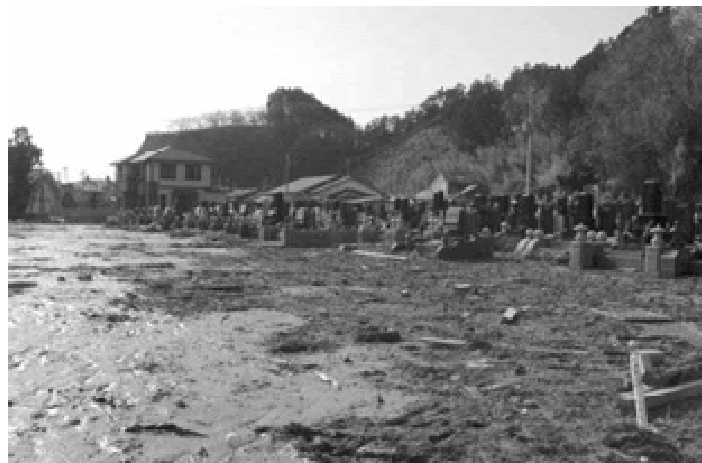
宮城県 曹洞宗寺院

〔コメント〕大震災による瓦礫は随分片づいたものの、状況は何も変わっていないようです。遠方に移転した檀家の方々もあり、寺院の運営も難しくなると思います。