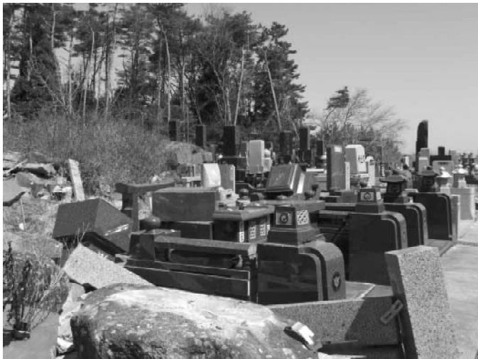
宮城県 真言宗智山派寺院

〔コメント〕大震災による瓦礫は随分片づいたものの、状況は何も変わっていないようです。遠方に移転した檀家の方々もあり、寺院の運営も難しくなると思います。