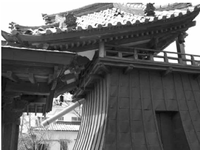
宮城県 天台宗寺院

(写真は墓地に津波によりドロが漂着した模様) 〔コメント〕震災でお亡くなりになられた方々が、「もう一度、我が故郷、この郷土に生まれてきたい」と思っている地域に再生することが、我々残されし者の最大の使命であると考えます。過分なる支援金、本当にありがとうございました。