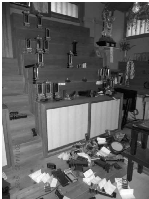
岩手県 曹洞宗寺院

山内柱ずれ、鐘堂全壊、壁・屋根破損。 〔コメント〕寺院（建物）復興に努力しております。