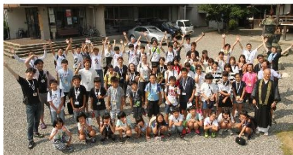
2019ふくしまの子どもたちをみえへプロジェクト Project Vol.8 August 16-24, 2019