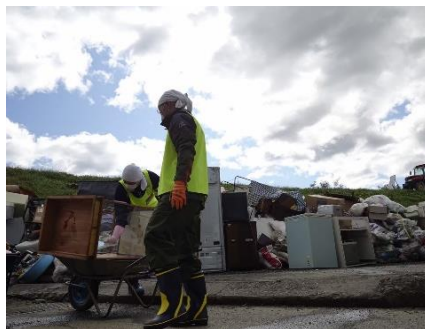
災害ゴミ搬出作業