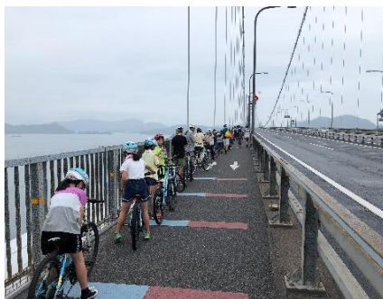
しまなみ海道サイクリング