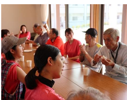
復興公営住宅での交流会