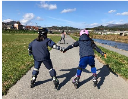
インラインスケート体験教室