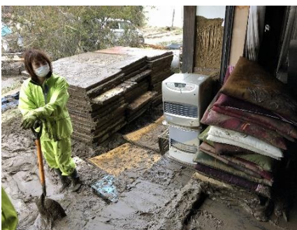
本堂・庫裡・墓地の土砂除去作業