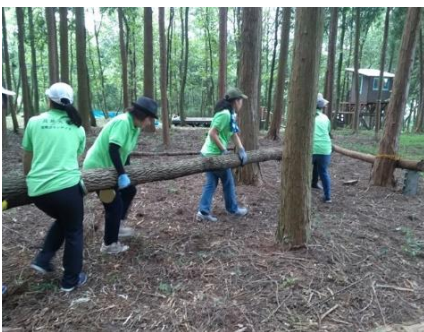
地域交流センターの増築作業