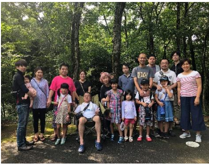
自然散策での集合写真