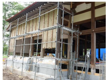
被災した寺院の様子