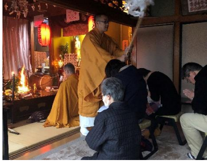
慰霊法要・復興祈願の護摩