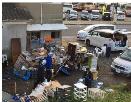
被災宅の家財道具等を屋外へ撤去