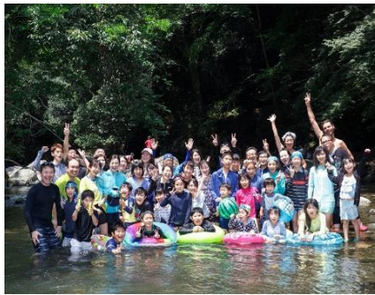
川遊びでの集合写真