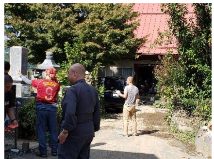
庫裡・客殿・境内の清掃作業